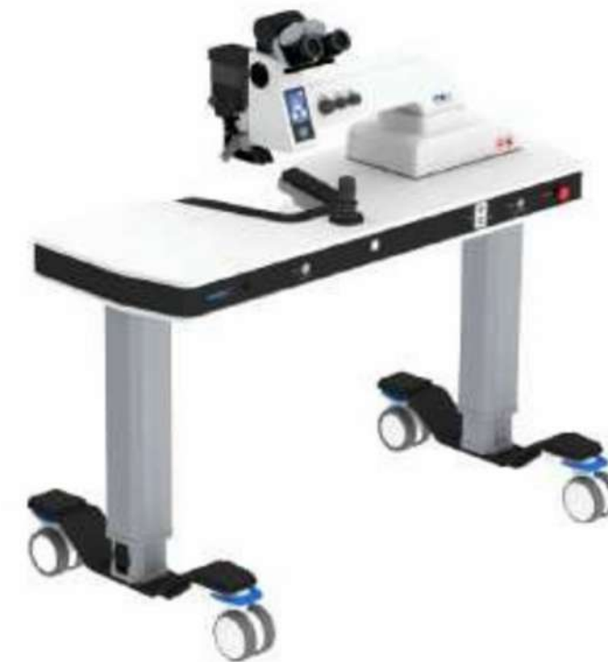
MRQ YAG SUPINE