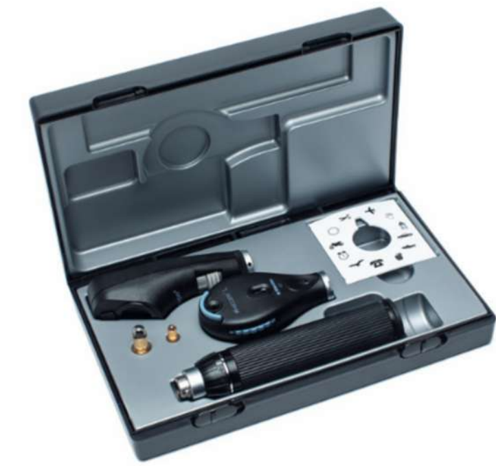
ri-vision KIT Retinoscopio/Oftalmoscopio