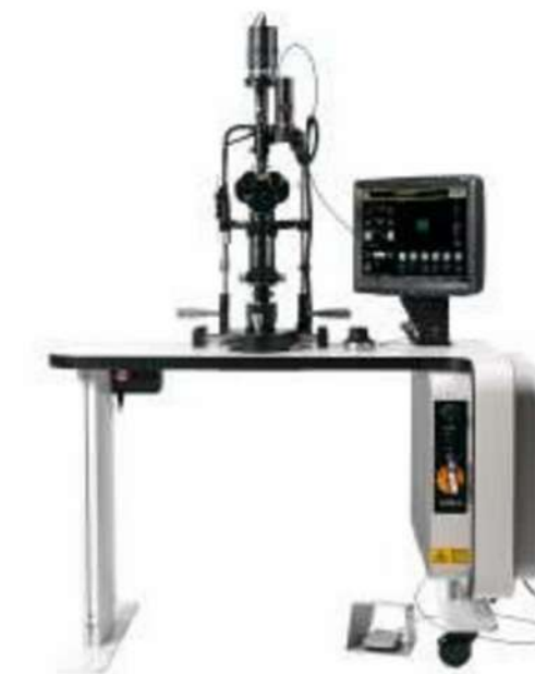
MULTISPOT LÁSER TT577