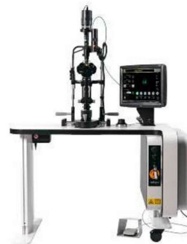
MULTISPOT LÁSER TT532