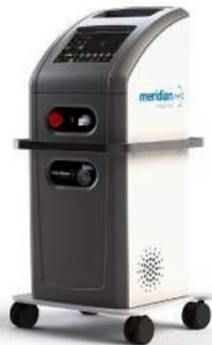
MULTISPOT LÁSER 5G532