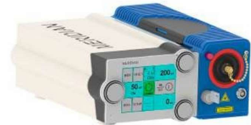
MERILAS 810 SHORTPULSE LÁSER