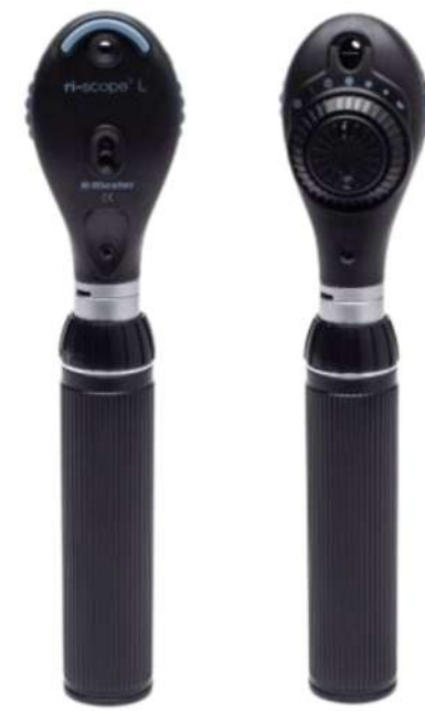
ri-scope® L Oftalmoscopio LED