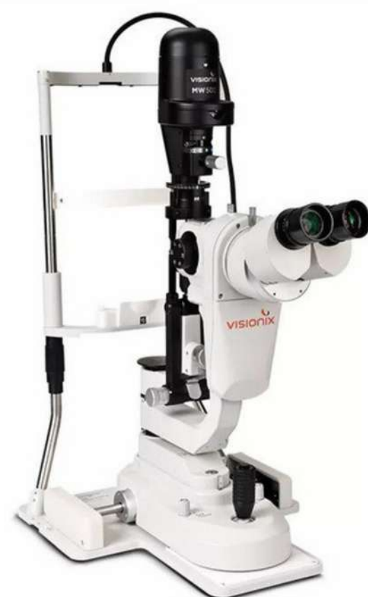
MW 50D Digital