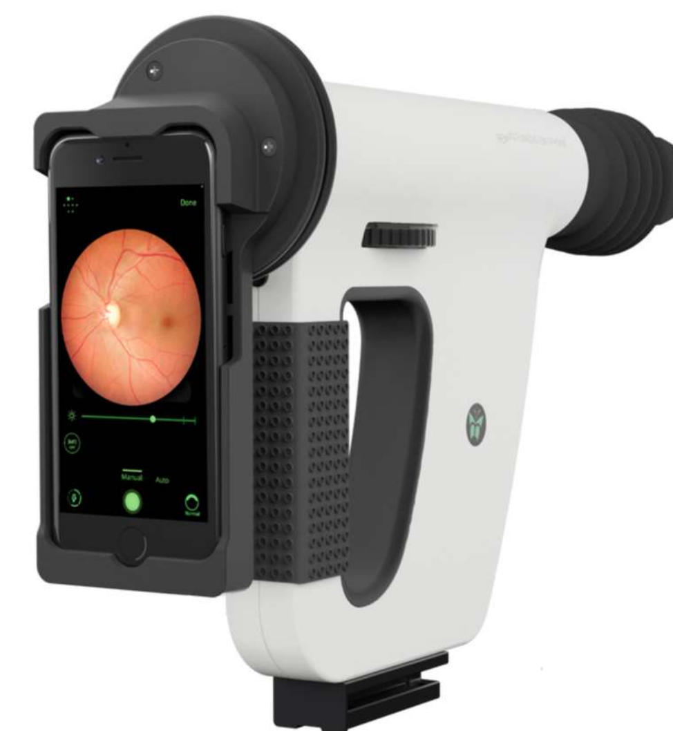
Remidio FOP NM-10