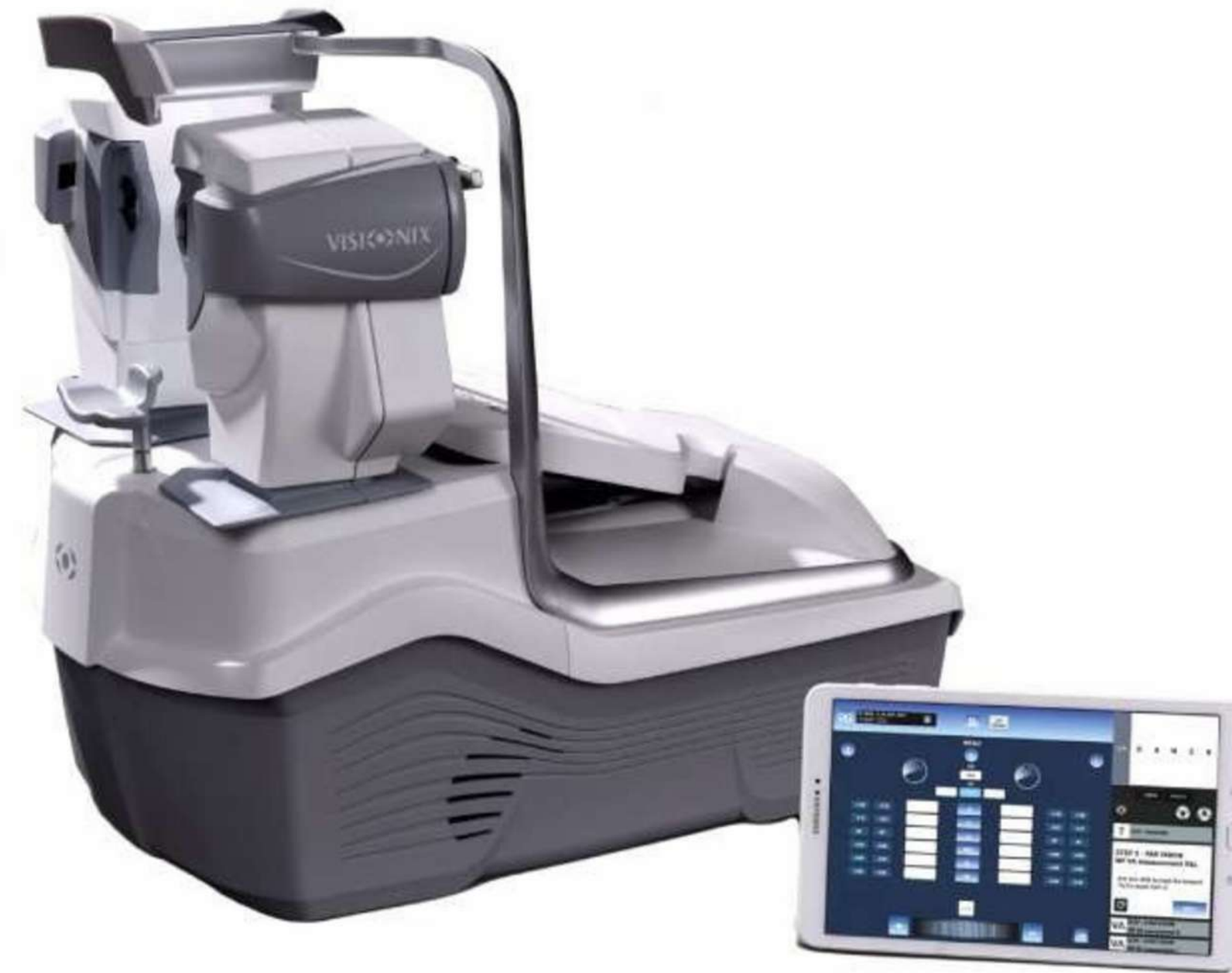
SISTEMA DE REFRACCIÓN BINOCULAR DESARROLLADO POR I. A.