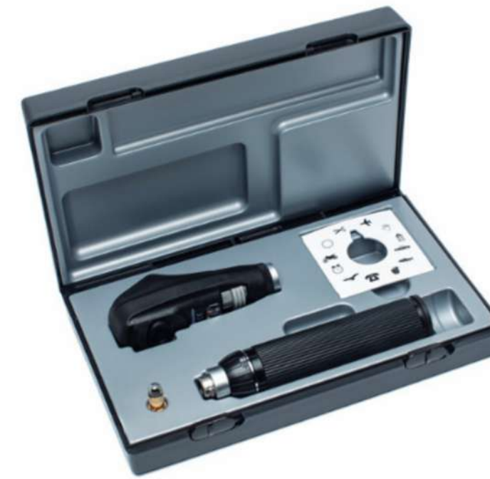
ri-scope® L Retinoscopio