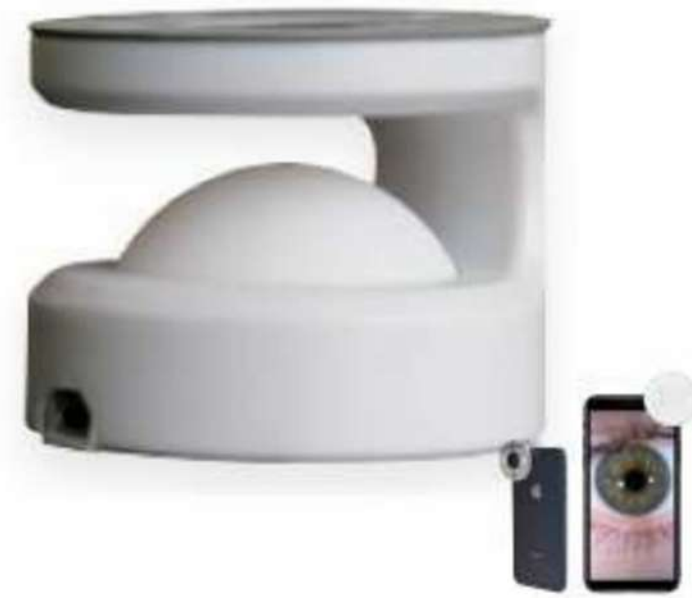
ADAPTADOR CÁMARA SMARTPHONE