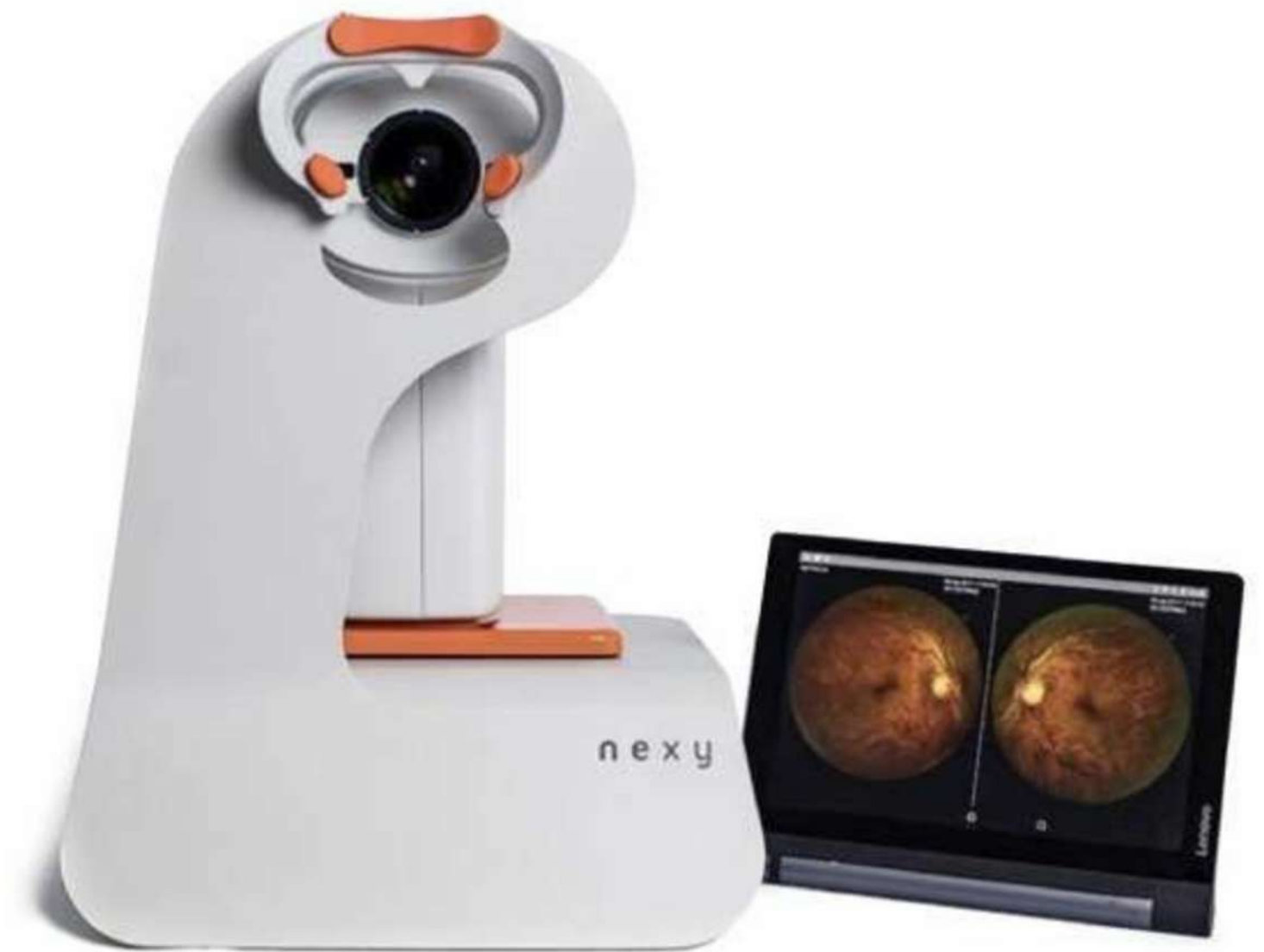
CÁMARA RETINAL NO MIDRIÁTICA