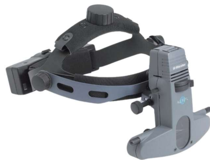
Oftalmoscopio indirecto All Pupil II