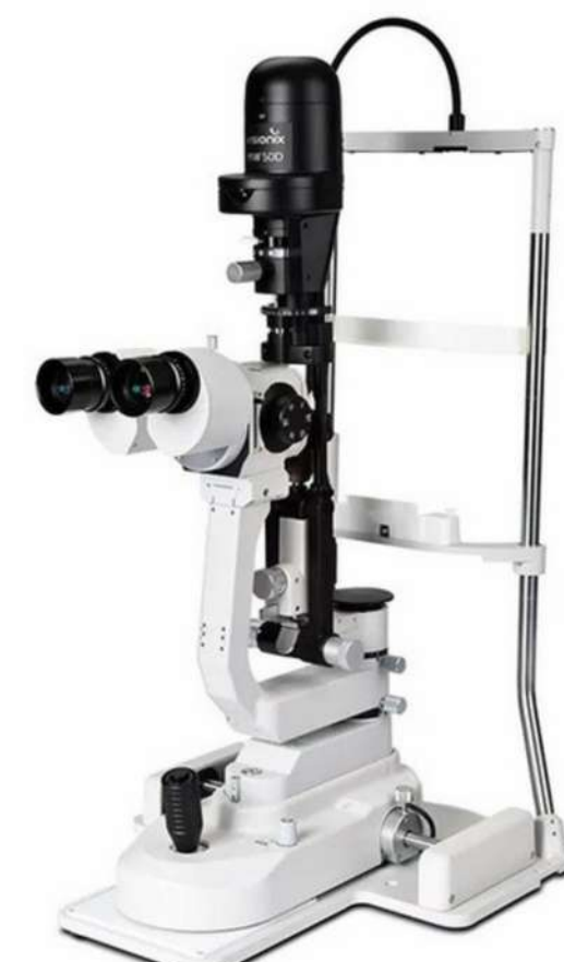
MW 50D Clinical