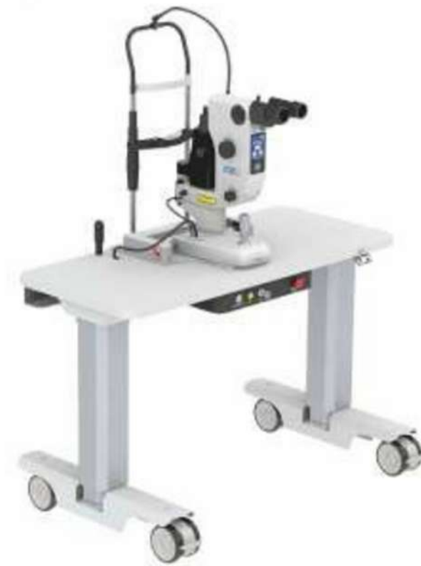
MRQ SLT / YAG LÁSER